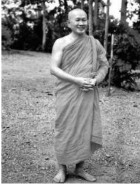
פראיוד א. פאיוטו

פראיוד פאיוטו Prayudh Payutto המוכר גם בשמו הנזירי הנוכחי פרה ברהמאגונאבהורן, הנו נזיר בודהיסטי תאילנדי המוכר היטב ברחבי העולם הבודהיסטי והעולם המערבי. מאז תחילת שנות ה-70, נחשב פאיוטו כאחד מהמלומדים הבולטים והמבריקים ביותר בהיסטוריה הבודהיסטית התאית. שמו יצא ברבים כאינטלקטואל המאופיין בהשכלה